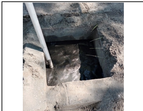
Fotografía No. 7 Tope de llenado con arena de río.

Hasta este punto se realizó acompañamiento técnico el día 23/01/2024, por cuanto no tenían el cemento para la preparación de la mezcla de concreto para el llenado final de la cavidad del aljibe. Actividad que realizaron posteriormente como sustentan en el informe remitido con Radicado 2024ER32118.