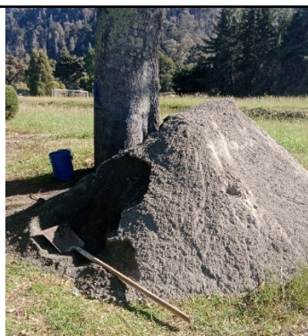
Fotografía No. 3 Arena de río para el llenado del aljibe.