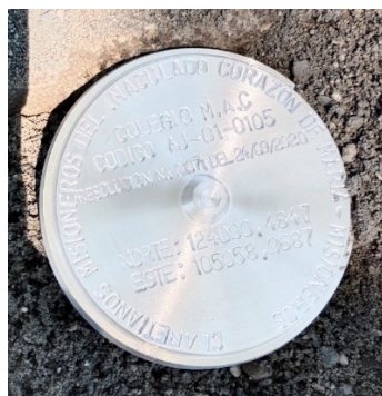
Fotografía No. 4 Placa de identificación para colocar al finalizar el sellamiento.