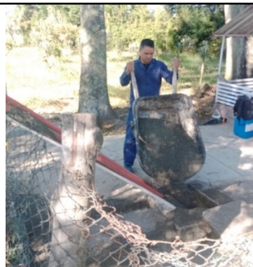
Fotografías No. 5 y 6 Llenado de la cavidad del aljibe con arena de río.